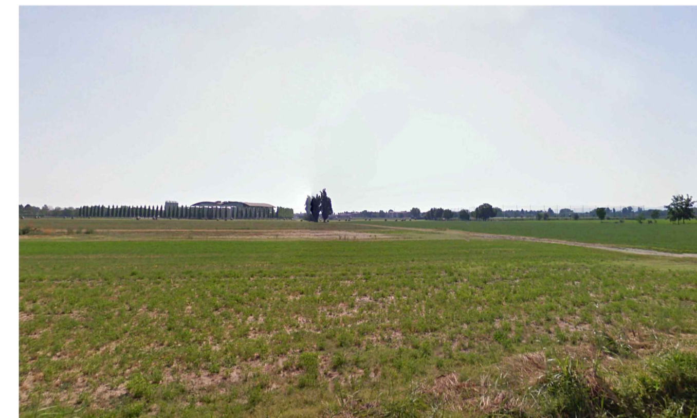
07 - FOTOINSERIMENTO - stato di fatto