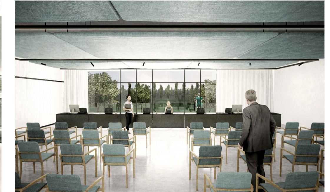
HEADQUARTER - VISTA INTERNA SALA RIUNIONI