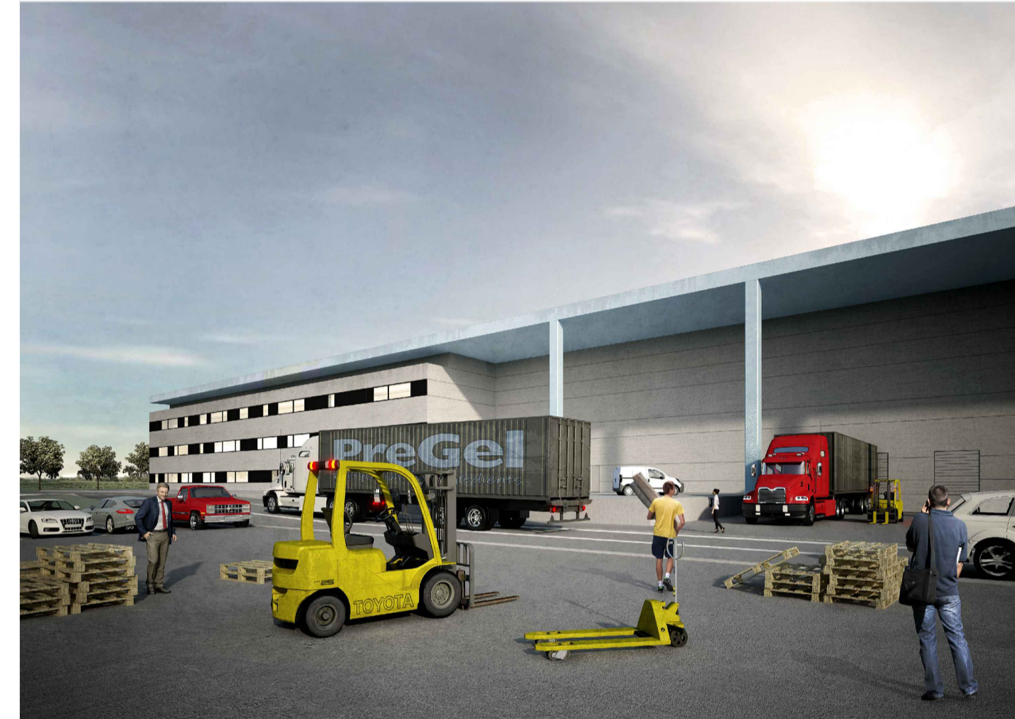
03 - CAPANNONE - VISTA ESTERNA