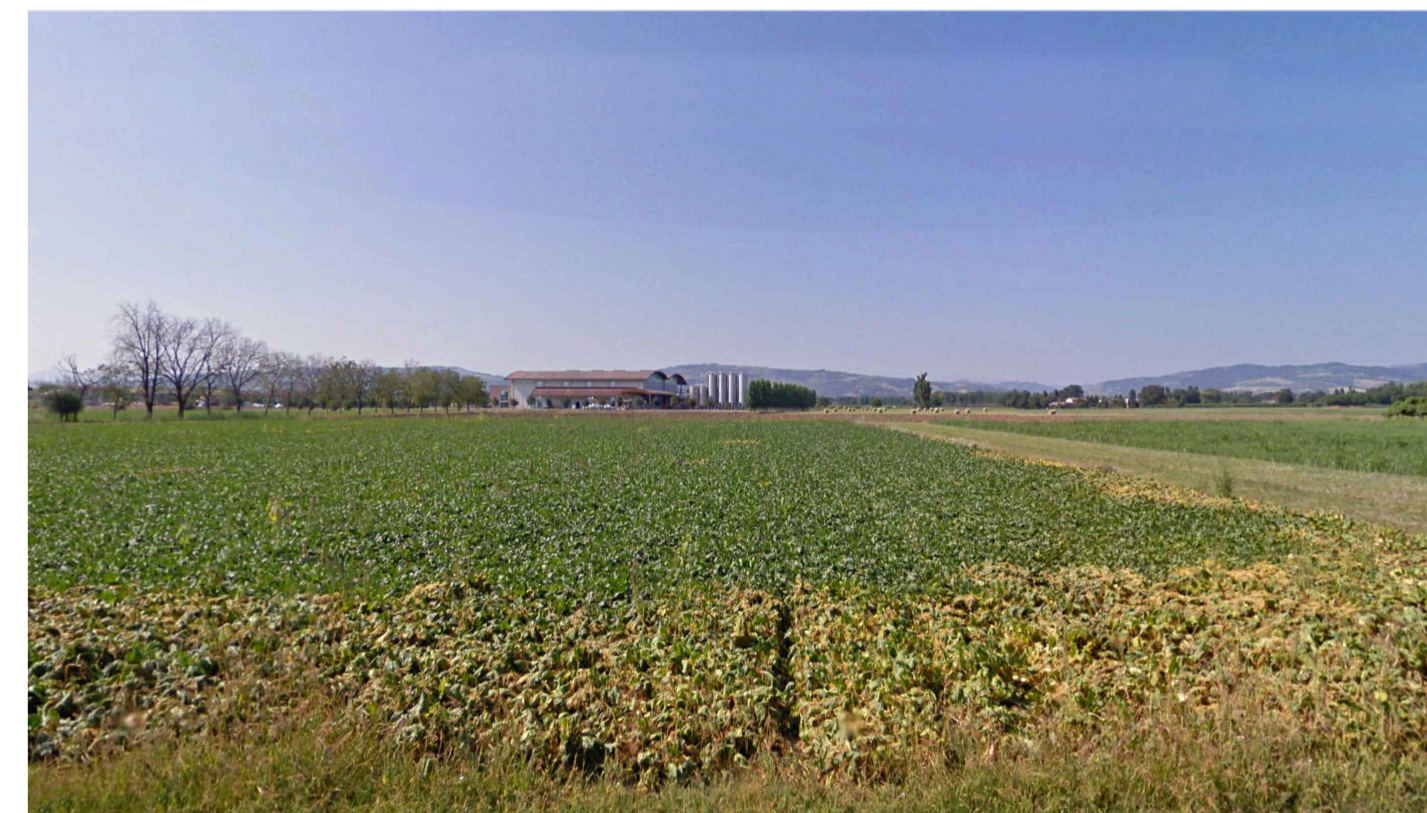
06 - FOTOINSERIMENTO - stato di fatto