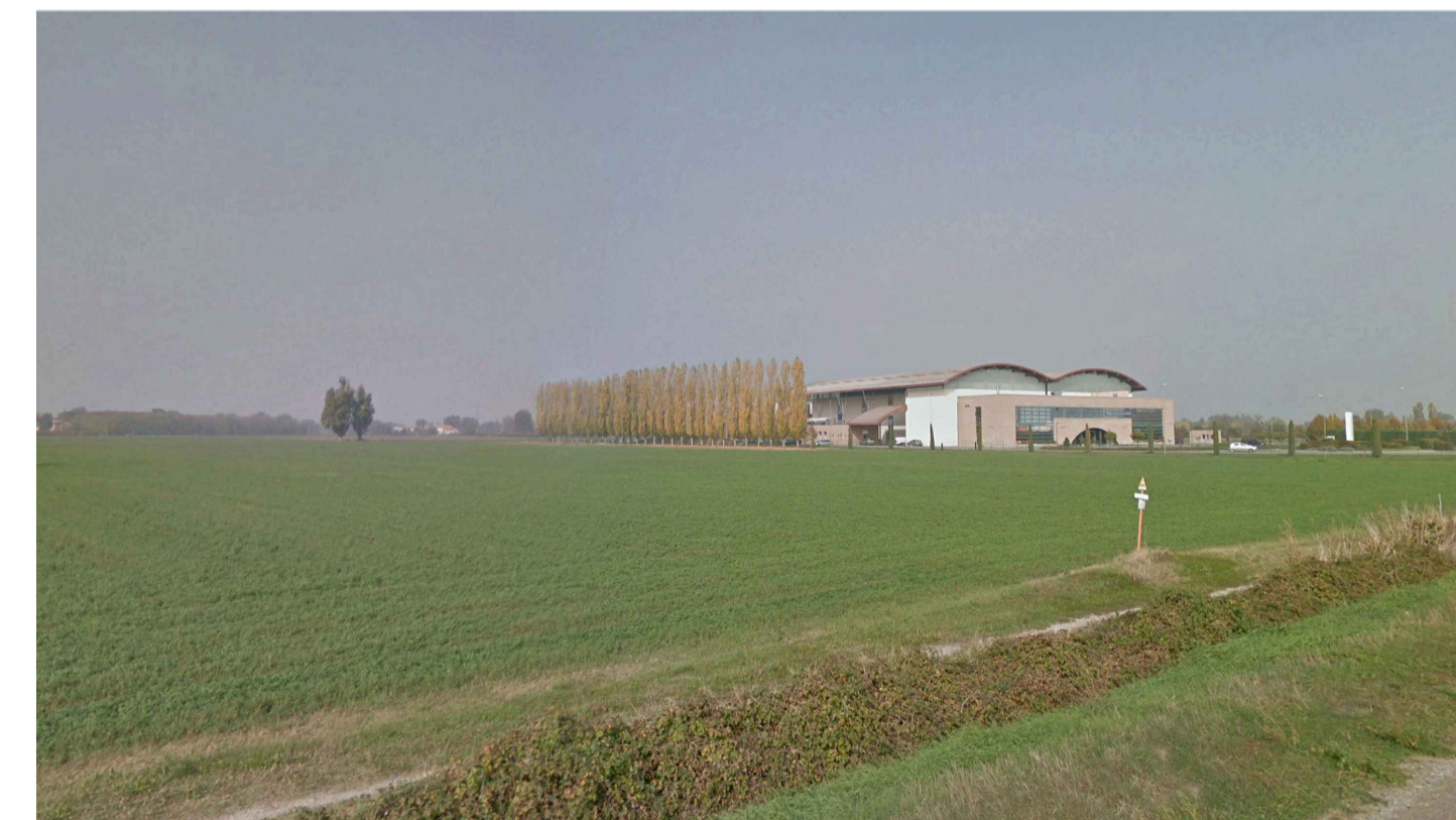
05 - FOTOINSERIMENTO - stato di fatto