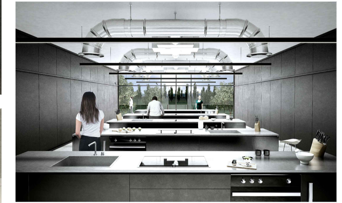
HEADQUARTER - VISTA INTERNA AULA CORSI