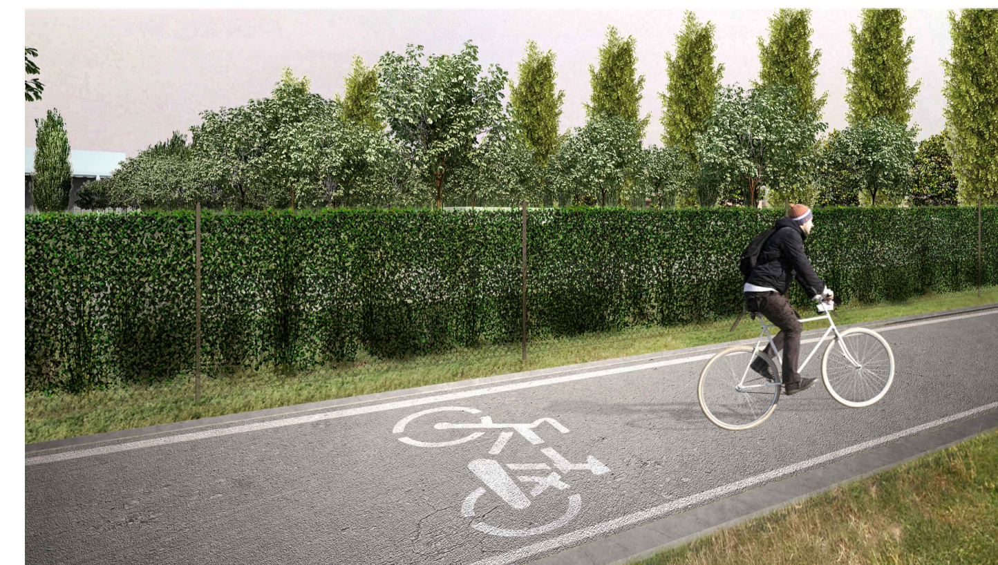
05 - FOTOINSERIMENTO - stato di progetto