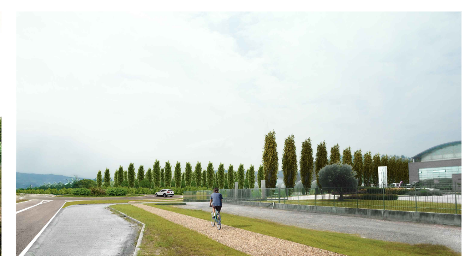
08 - FOTOINSERIMENTO - stato di progetto