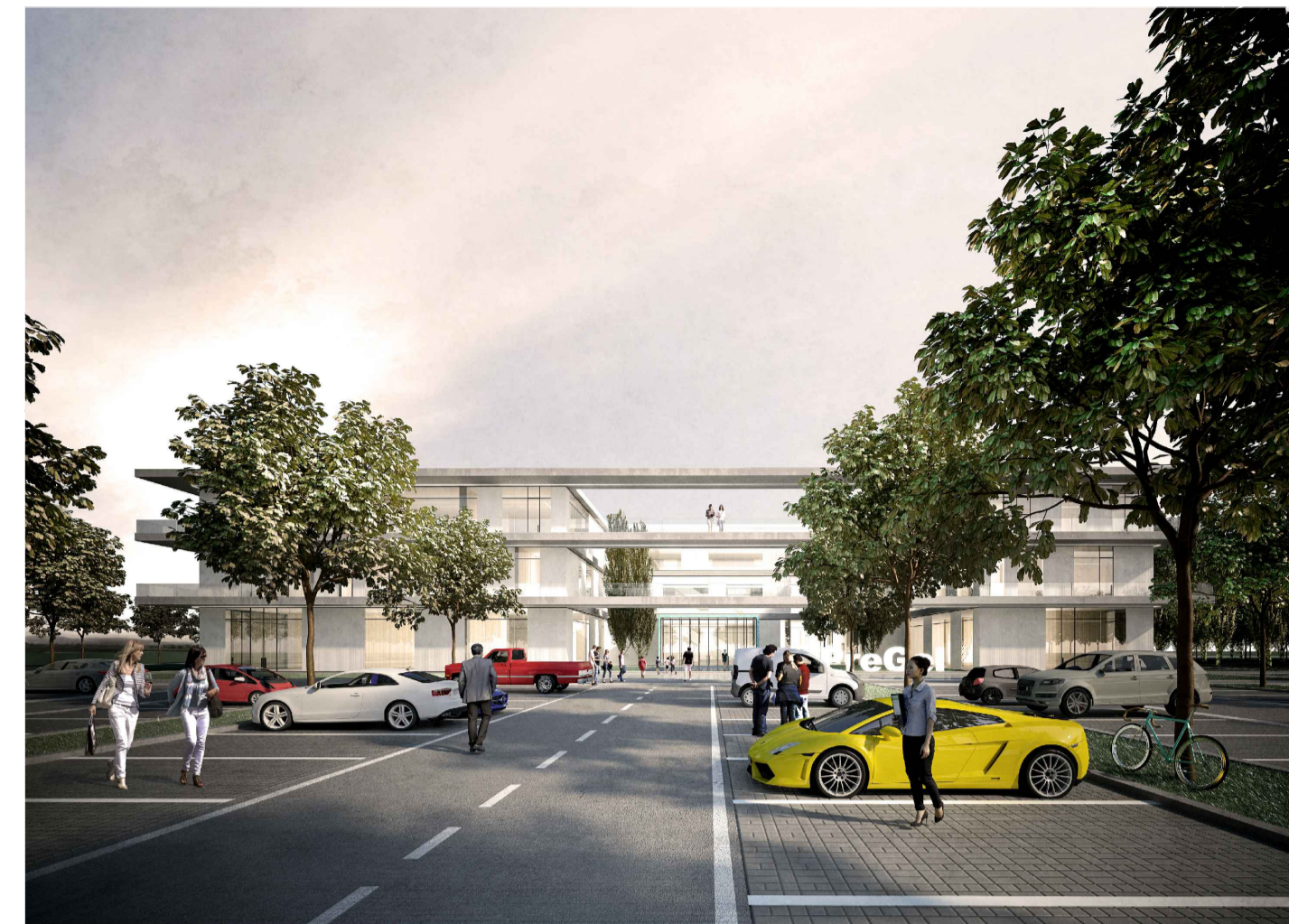
02 - HEADQUARTER - VISTA ESTERNA