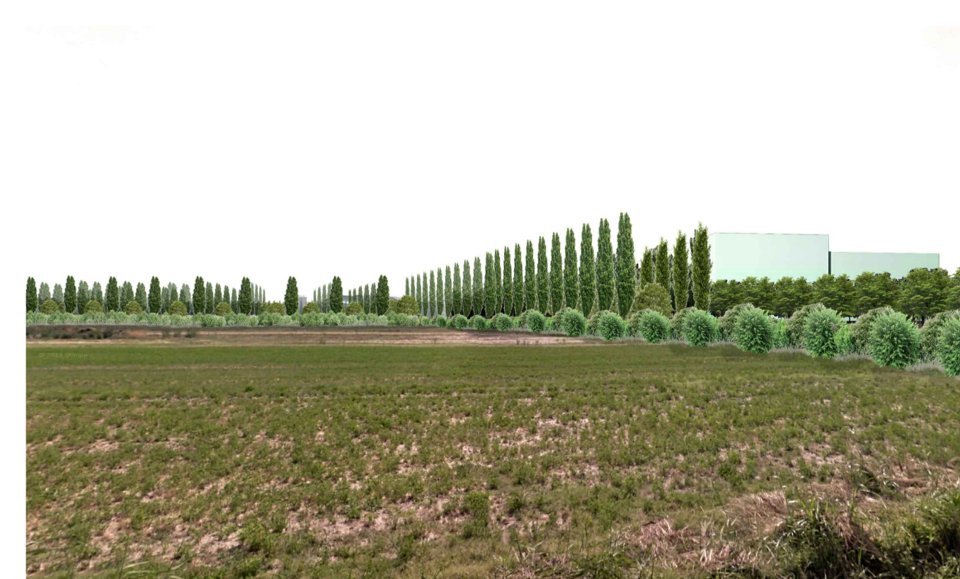
07 - FOTOINSERIMENTO - stato di progetto