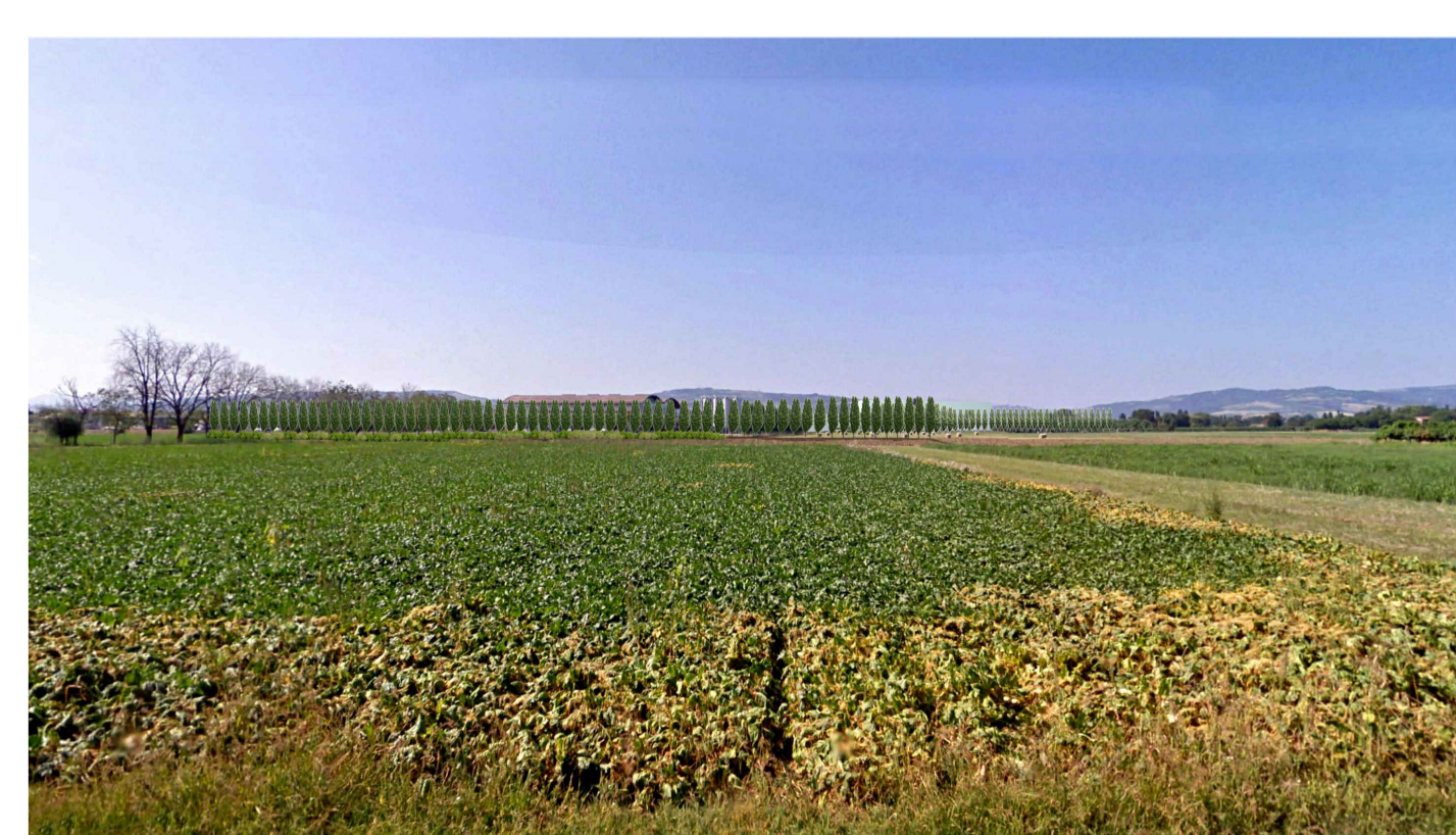
06 - FOTOINSERIMENTO - stato di progetto