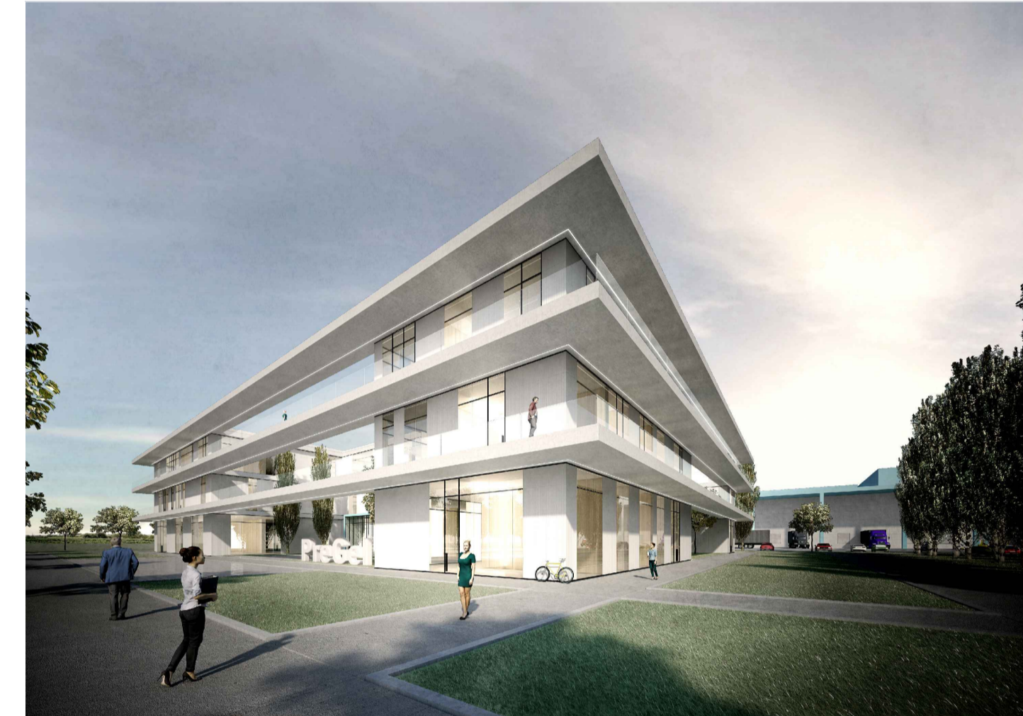
01 - HEADQUARTER - VISTA ESTERNA