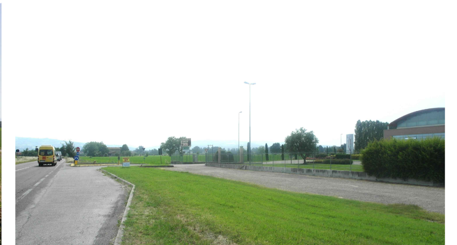
08 - FOTOINSERIMENTO - stato di fatto