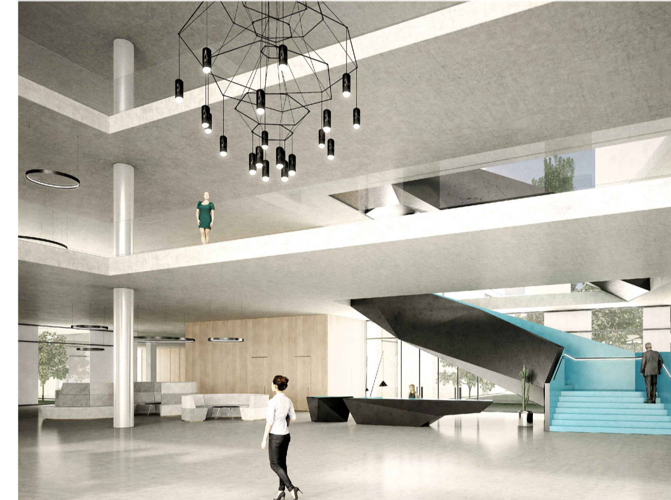
HEADQUARTER - VISTA INTERNA DEL FOYER DI INGRESSO