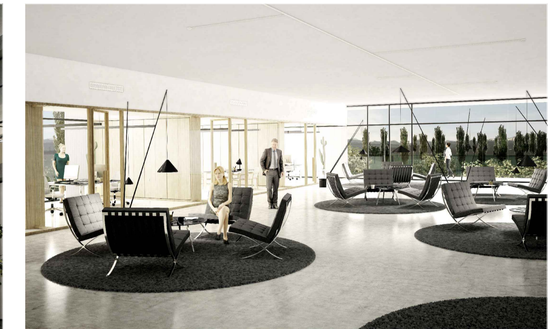
HEADQUARTER - VISTA INTERNA DEGLI SPAZI CONNETTIVI E DI ATTESA