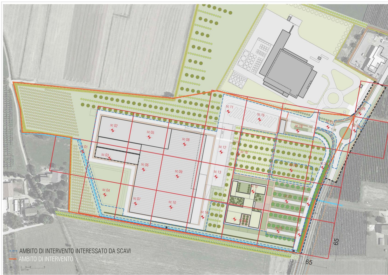
Fig. 2. Semina indicativa dei punti di prelievo campioni